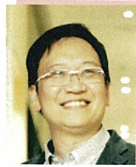
社長當選人 就職典禮籌備會主委

最後謝謝各位扶輪先進給予的機會，讓我能有機會去承擔、去學習更進一步的扶輪生活，希望扶輪精神的傳承帶來大家更幸福的家庭、更成功的事業以及更廣大心胸去面對學習服務這個社會。