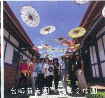
台版兼六園 成美文化園