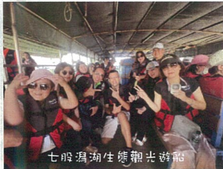
七股瀉湖生態觀光遊船