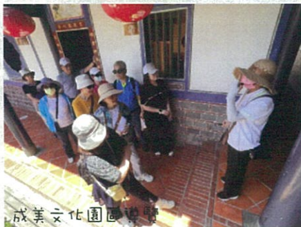
成美文化園區參觀