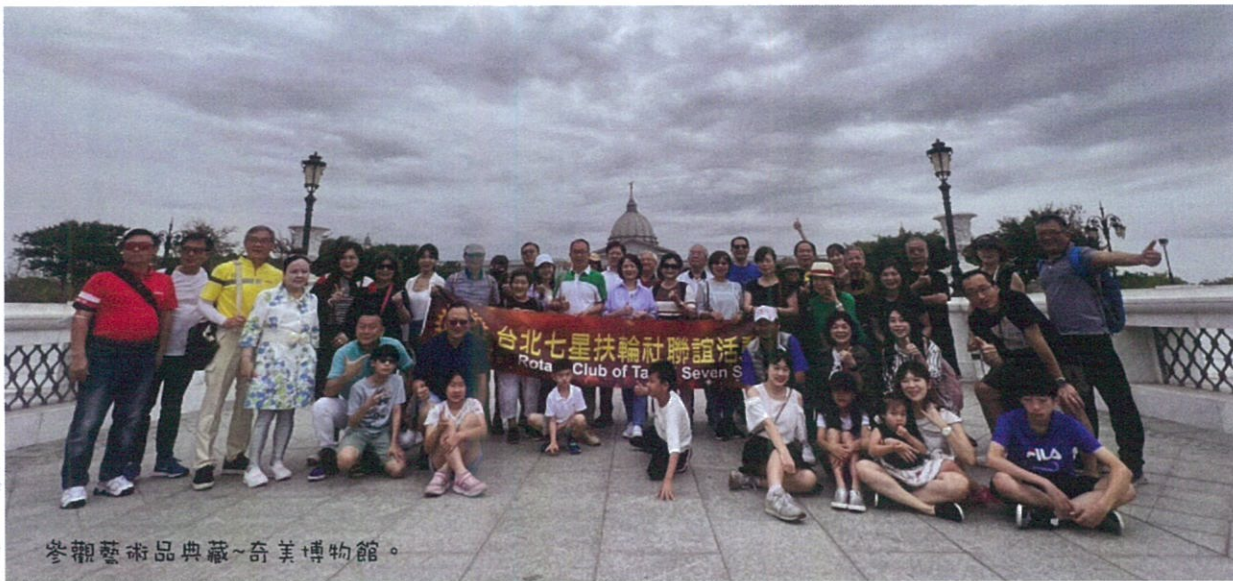
參觀藝術品典藏~奇美博物館。