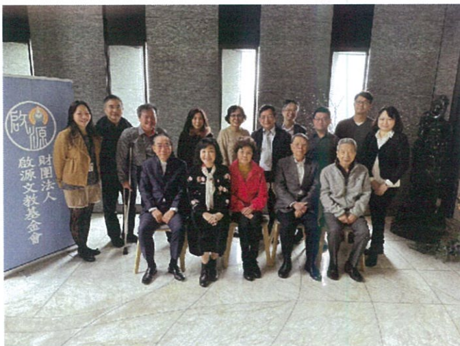
PP. Marlboro 及PP. Alban就任財團法人啟源文教基金會第八屆董事。