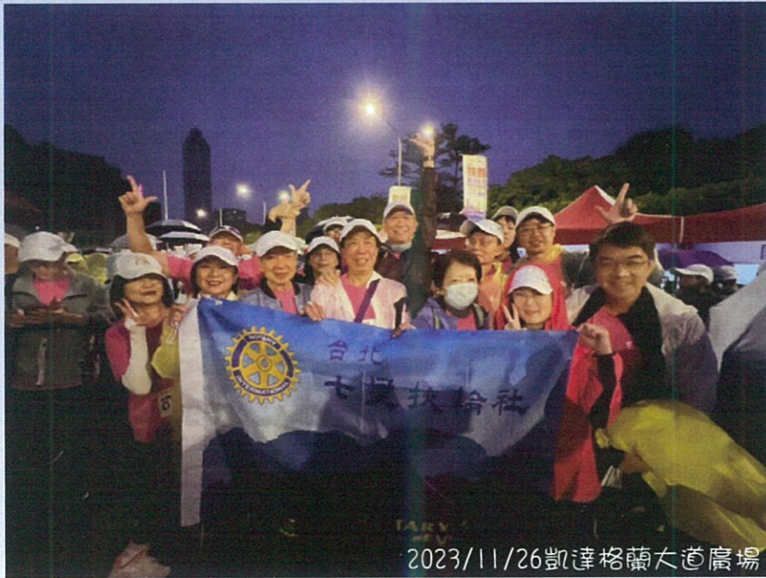
2023/11/26凱達格蘭大道廣場